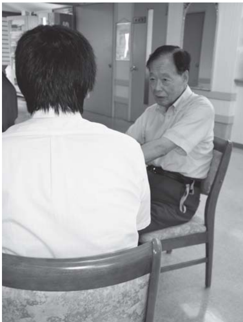
総合生活相談の様子

事業の要となるCSWには、①訪問を原則とし(アウトリーチ)、②その人の住まいで向き合って状況を把握し(課題の発見)、③解決方法を模索し、状況を把握し(フットワーク)、④その人に寄り添い、同じ立場で課題を共有し(課題解決のパートナー)、⑤自らの感性と相談援助技術により(福祉性・専門性)、⑥民間の活動として制度にとらわれずに対応し(自由・柔軟性)、⑦必要だと判断すれば、経済的援助を行う(解決手段を持った活動)等が求められる。