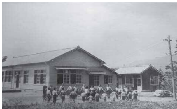
創設期のみのり園

その後施設は、関係者の努力により逐次、充実と定員増が図られ、1962(昭和37)年には日出町に精神薄弱者更生施設(当時。現在の障害者支援施設)白百合園、1964(昭和39)年には杵築市に精神薄弱者更生施設白萩園、その後、1974(昭和49)年には特別養護老人