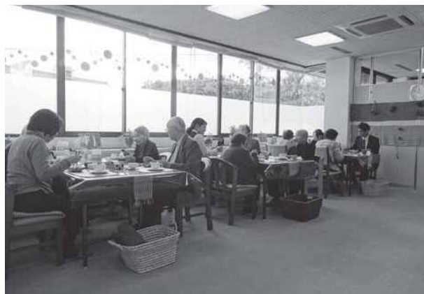
福ろう内の認知症カフェ