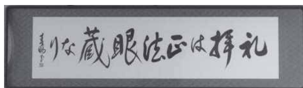
法人創設の精神を掲げた額

2000(平成12)年に社会福祉基礎構造改革がスタートし、同年には介護保険制度が開始された。その後、障害者支援費制度が実施され、社会福祉制度の改革が始まった。時期を同じくして、当法人は、創設50周年を迎え2代目の