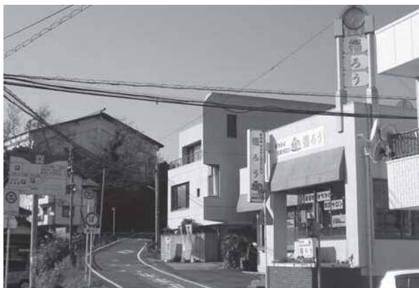
まちかど交流サロン 福ろう

当法人の、法人外部への発信を企図した活動は、まだまだ端緒を開いたばかりである。地域社会での地道な活動を継続していくことが福祉社会を完成させる近道であり「地域から愛され、認められる法人」に繋がって行くと考える。