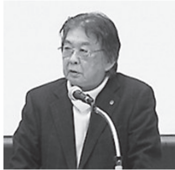
大阪府・岩田会長