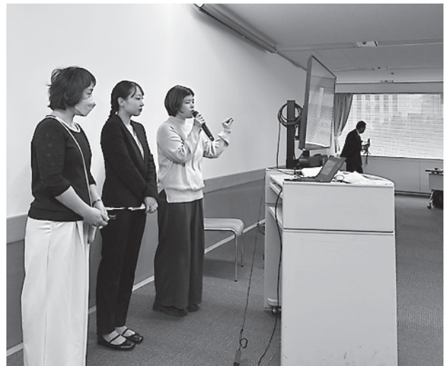
当日の発表の様子