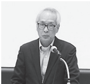
奈良県・矢追会長