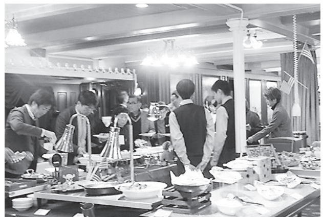
ミシガンクルーズ (琵琶湖汽船) の外観および情報交換会の様子