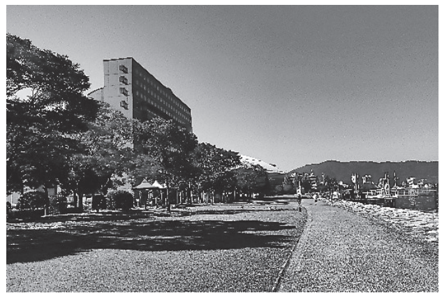
琵琶湖畔の「なぎさ公園」からピアザ淡海を臨む

今回は、経済格差の増大や人口減少により地域社会が変容し、また、人材確保が極めて困難な中、「福祉経営管理者として福祉施設士はどのように経営を舵取りしていくのか」を開催の趣旨として、近畿一円はもとより、全国各地から46名(内オンライン参加2名)のご参加をいただきました。