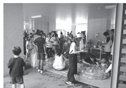
行事写真(2025年7月5日に行われた七夕まつり)