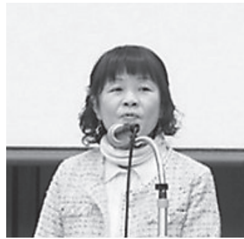
和歌山県・高垣会長

活動の質・量ともに低下している現状が報告されました。一方で、大阪府および奈良県は事務局業務を府県社協が担い、他団体との連携や情報共有が進むなど、会としては非常に有益な取り組みが行われていることも紹介されました。