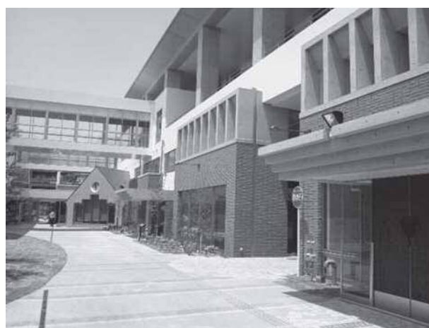
芦屋メンタルサポートセンター外観

2014(平成26)年4月には、芦屋市より従来の相談支援事業に加え芦屋市基幹相談センター事業業務を受託し、現在に至っている。